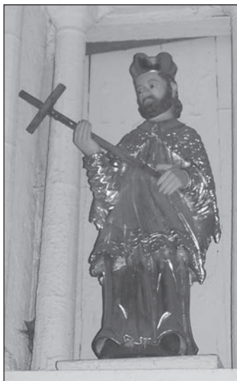
Fot. 7. Kościół parafialny p.w. św. Mikołaja i św. Doroty w Kwiatkowicach, rzeźba św. Jan Nepomucen

Wśród ruchomości pozostających w posiadaniu parafii należy wspomnieć także dwie, pochodzące z początku XVII w., drewniane, polichromowane rzeźby: Madonna Immaculata oraz św. Jan Nepomucen. Pierwsza z nich jest obecnie eksponowana na ołtarzu południowym [fot. 6] 32 , natomiast druga została umieszczona w niszy w południowej ścianie nawy kościoła [fot. 7].