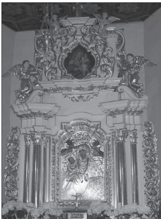
Fot. 3. Kościół parafialny p.w. św. Mikołaja i św. Doroty w Kwiatkowicach, ołtarz główny

główny, oraz wykorzystana w partii wyższej para pilastrów. Głównym elementem zdobniczym jest motyw liści akantu wykorzystany zarówno przy wykonaniu uszu, jak również w obramieniach obrazów umieszczonych w ołtarzu. Obok ornamentu akantowego uwagę zwraca dekoracja uszu w drugiej kondygnacji ołtarza, w których wykorzystano element kratki i taśmy regencyjnej, potwierdzającej wspomniane powyżej datowanie ołtarza.