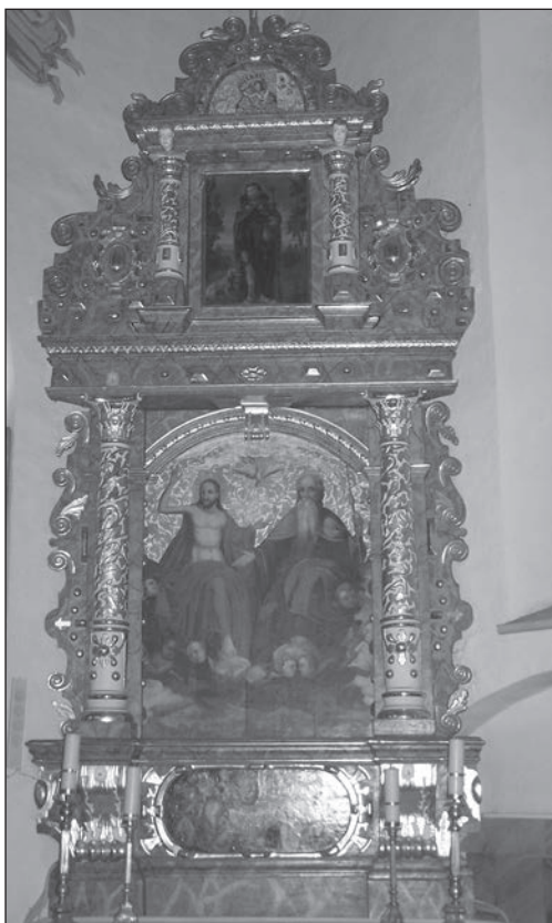
Fot. 4. Kościół parafialny p.w. św. Mikołaja i św. Doroty w Kwiatkowicach, ołtarz boczny południowy – Świętej Trójcy

ciątkiem, a na wieńczącym ołtarz gzymsie umieszczono pełnoplastyczną rzeźbę św. Kazimierza. W pochodzących z XVIII i XIX w. opisach wyposażenia kościoła nie wspomniano jednak o wieńczącej ołtarz figurze, podczas gdy wśród umieszczonych w ołtarzu obrazów, obok przedstawień Madonny z Dzieciątkiem, patrona parafii św. Mikołaja i św. Józefa, wymieniany był jeszcze wizerunek św. Rocha 17 .