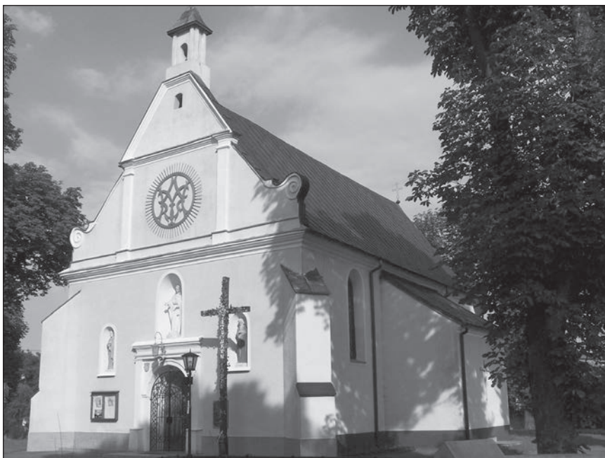
Fot. 1. Kościół parafialny p.w. św. Mikołaja i św. Doroty w Kwiatkowicach

Tytułowy kościół jest budowlą nieorientowaną, zbudowaną z cegły i tynkowaną zarówno wewnątrz, jak i na zewnątrz. Stanowi on przykład jednonawowej świątyni z przylegającym do korpusu węższym, wielobocznie zamkniętym prezbiterium. Od strony północnej przy prezbiterium znajduje się zakrystia, przy korpusie zaś, od strony południowej umieszczono prostokątne pomieszczenie. W planie kościoła dostrzec można podobieństwo do świątyń budowanych z fundacji szlacheckiej od końca średniowiecza na terenie Wielkopolski, ale także murowanych obiektów z terenu dawnego archidiakonu uniejowskiego, w którego granicach w okresie nowożytnym znajdował się omawiany obiekt 8 . Wyraźne podobieństwo wykazują chociażby świątynie w Sobocie i Otorowie o planach stanowiących niemal wierne odbicie planu kościoła kwiatkowickiego 9 . Do grupy świątyń o planie wykazującym liczne podobieństwa zaliczyć można nieco późniejsze niż omawiany obiekty w Drużbinie i Zadzimiu, które jednak, w przeciwieństwie