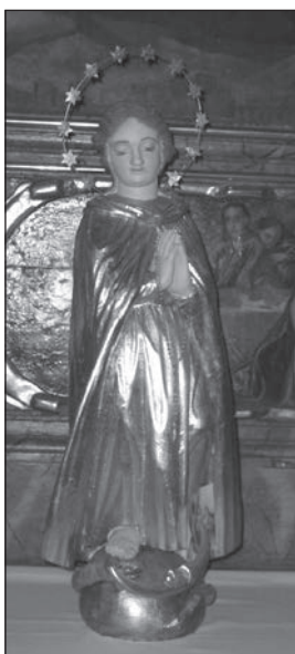
Fot. 6. Kościół parafialny p.w. św. Mikołaja i św. Doroty w Kwiatkowicach, rzeźba Madonna Immaculata

Ponadto w południową ścianę prezbiterium (w łuku tęczowym) wmurowana została tablica erekcyjna z czerwonego marmuru. Pole z inskrypcją obwiedziono bordiurą, w dolnej części pola umieszczono dwa herby: Rola i Jastrzębiec. Tekst wskazuje również na drugą funkcję tablicy 30 , rozumianej jako płyta nagrobna, przez co nadaje ona kościołowi funkcję mauzoleum fundatorów. Opinię taką potwierdza kwestionariusz pochodzący z 26 listopada 1824 r. z kluczowym dla poruszanego zagadnienia pytaniem: Jakie nagrobki w nim [kościół] lub przy nim znajdują się? – Nagrobek w środku kościoła przy prezbiterium w murze [...] z napisem następującym [respondent ankiety przytacza w tym miejscu wspomniany napis z tablicy erekcyjnej] 31 .