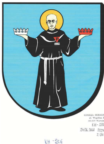
Ryc. 2. Herb powiatu zduńskowolskiego (projekt przesłany do Komisji Heraldycznej 20 kwietnia 2000 r.)

posługiwania się herbami. W dalszej części wniosku znajdują się uwagi na temat użytkowych walorów herbu powiatowego, który jest symbolem dysponenta, znakiem rozpoznawczym, a także skutecznym narzędziem do prowadzenia akcji promocyjnych. Wniosek wpłynął do sekretariatu Komisji Heraldycznej 25 kwietnia 2000 r.