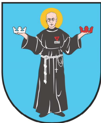
Ryc. 1. Herb powiatu zduńskowolskiego (herb uchwalony 24 listopada 2000 r.) Źródło: http://www.powiatzdunskowolski.pl – symbole powiatu (15.02.2014)

rozpostarte i lekko uniesione od ugięcia łokci. Na dłoniach św. Maksymiliana położone są dwie korony – biała na prawej i czerwona – na lewej dłoni. Postać świętego umieszczona została na błękitnym polu tarczy herbowej.