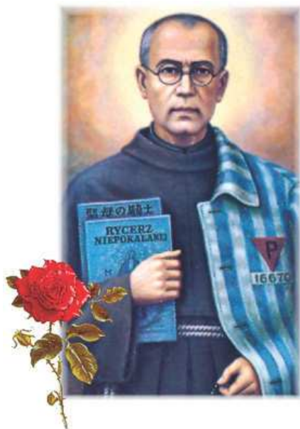
Ryc. 3. Maksymilian M. Kolbe w habicie franciszkańskim i pasiaku obozowym