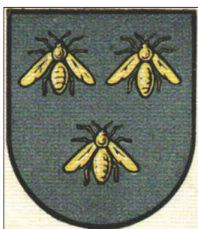
Ryc. 5. Herb Zduńskiej Woli

w podobnej sprawie (herb Konstakynowa Łódzkiego 31 ) można wnioskować, iż eksperci z Warszawy mogli zasugerować radnym Zduńskiej Woli, aby ci zgodzili się zredukować znak miasta do jednego herbu (Prawdzie Złotnickich) lub – co z uwagi na fascynację ówczesnych ekspertów heraldycznych XIX-wiecznym Albumem herbów miast Królestwa Polskiego 32 – mogli postulować wykorzystanie trzech pszczoł do zbudowania godła miejskiego Zduńskiej Woli. Hipotezę na temat ewentualnego promowania już w latach 30. XX w. trzech pszczoł na błękitnym polu, jako poprawnego herbu Zduńskiej Woli, wzmacnia dowód w postaci ustaleń Mariana Gumowskiego, spopularyzowanych w 1930–1932 r. na kartach Herbarza Polski 33 . Gumowski utrzymywał, że herbem Zduńskiej Woli powinny być pszczoły z Albumu herbów miast Królestwa Polskiego z połowy XIX w.