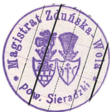
Ryc. 2. Pieczęć Magistratu Zduńskiej Woli (okres II Rzeczypospolitej)

herbu Ostoja 17 . Współczesny herb miejski opracowany został na wzór wyobrażenia z pieczęci magistrackich Zduńskiej Woli z okresu poprzedzającego odzyskanie II Niepodległości (1915–1918) 18 oraz z lat II Rzeczypospolitej (1918–1939) 19 (ryc. 2). Symbol międzywojennego samorządu Zduńskiej Woli występował także na pieczęciach urzędów i instytucji związanych z miastem. Na przykład z 1920 r. pochodzi odcisk pieczęci Urzędnika Stanu Cywilnego przy Magistracie Zduńskiej Woli 20 . Herb miasta (ukształtowany w okresie I wojny światowej) wykorzystywany był w Zduńskiej Woli także w pierwszych latach po zakończeniu II wojny światowej (np. w 1946 r.). Przypuszczam, że do 1947 r. w kancelarii miejskiej Zduńskiej Woli posługiwano się stemplami wykonanymi w okresie II Rzeczypospolitej, a nie nowymi tłokami przygotowanymi po styczniu 1945 r. Od 1947 r. dokumenty zduńskowolskie (np. Miejskiej Rady Narodowej w Zduńskiej Woli) pieczętowane były stemplami z wyobrażeniem niekoronowanego orła białego.