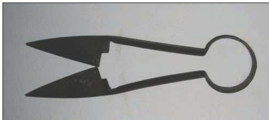
Fot. 2. Nożyce do strzyżenia owiec

Strzyżenie (po uprzednim myciu owiec) odbywało się dwa razy do roku (przeważnie na początku maja oraz we wrześniu, ewentualnie na początku października), przy użyciu specjalnie do tego celu skonstruowanych nożyc (fot. 2). Strzyżenie owiec w gospodarstwie chłopskim należało do obowiązków kobiet, owce folwarczne strzygły chłopki w ramach pańszczyzny.