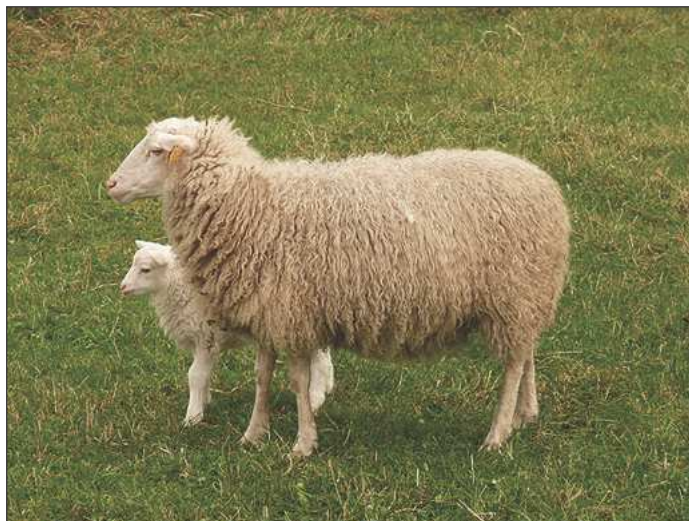
Fot. 1. Maciorka (samica) świniarki z jagniakiem

Hodowli owiec, która na ziemiach polskich towarzyszyła powszechnej uprawie zboża, poświęcono w literaturze historycznej stosunkowo mało uwagi 2 , uboga jest też literatura odnosząca się do rozwoju owczarstwa w regionie otaczającym Szadek.