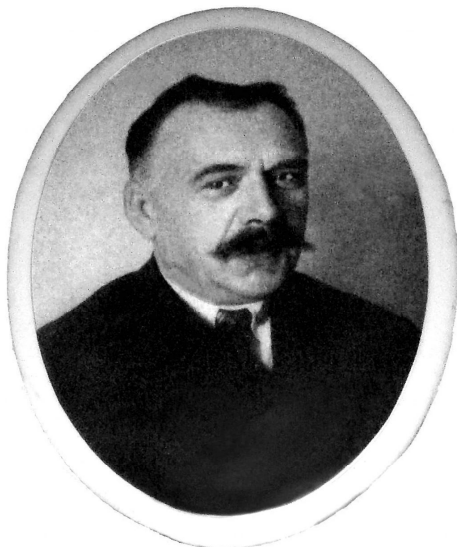
Fot. 1. Ignacy Lipiński

Grób doktora Lipińskiego przetrwał do dziś – położony jest w centrum cmentarza św. Wawrzyńca w odległości ok. 10 m na południe od krzyża, w pierwszym rzędzie po lewej stronie głównej alei cmentarnej (fot. 2) 10 .