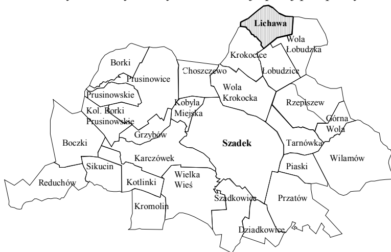
Rys. 1. Gmina Szadek w podziale na sołectwa

Jest to wieś jednodrożna zaliczana do typu ulicówek, cechuje się zwartą zabudową, z domami położonymi po obu stronach drogi. Widocznym elementem w fizjonomii wsi są obecnie nie wykorzystywane duże budynki gospodarcze, zbudowane z cegły w latach 70-tych i 80-tych, czyli czasach najlepszej prosperity.