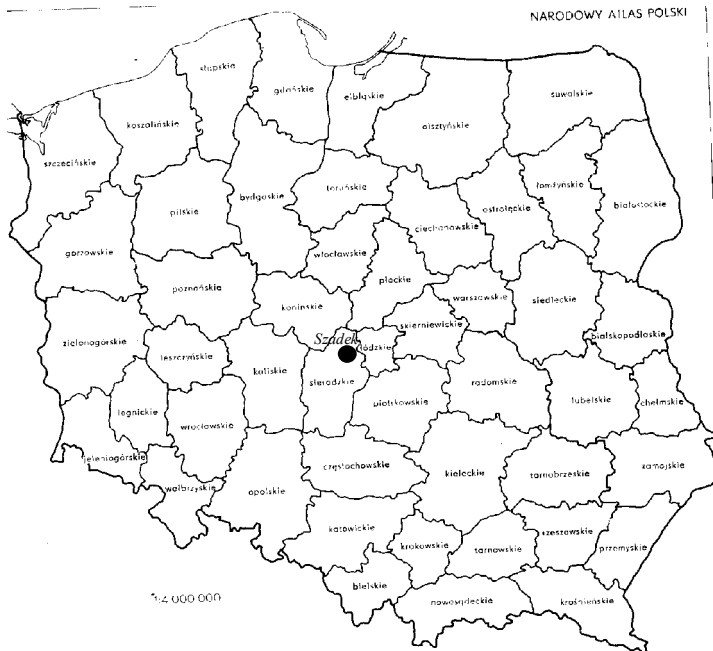
Rys. 4 Szadek po podziale administracyjnym Polski w 1975 r.

Gmina Szadek znalazła się ponownie w powiecie sieradzkim. Była ona położona przy wschodniej granicy powiatu, na krawędzi z powiatem łaskim. Pod względem podziałów specjalnych Szadek związany był z Sieradzem i w większości wypadków z Łodzią, będącą siedzibą władz wyższego szczebla administracji specjalnej. Szadek m.in. znalazł w Łódzkim Okręgu Wojskowym, podlegając pod Łódzką Izbę Skarbową, jednak pod względem podziału sądowego należał do Kaliskiego Okręgu Sądowego i Warszawskiego Okręgu Apelacyjnego. W tym okresie również zabrakło czynnika (np. przemysłu lub dogodnego połączenia komunikacyjnego) umożliwiającego rozwój miasta i napływ ludności, także w tym czasie ominęła go ważna droga Łódź-Pabianice-Łask-Sieradz.